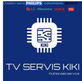
TV SERVIS KIKI